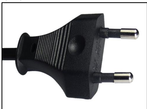
Imagen No 3 - Cable DC (6.1.4) Imágenes ilustrativas, sólo a modo de ejemplo