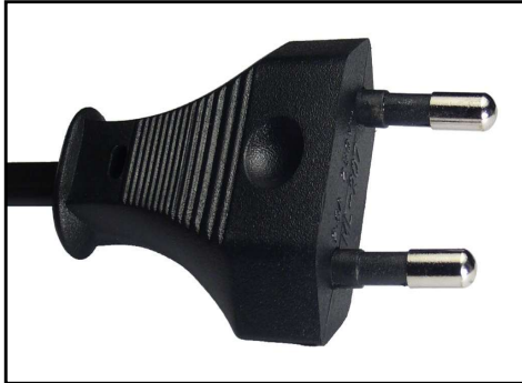
Imagen No 4 - Cable DC (6.1.5) Imágenes ilustrativas, sólo a modo de ejemplo